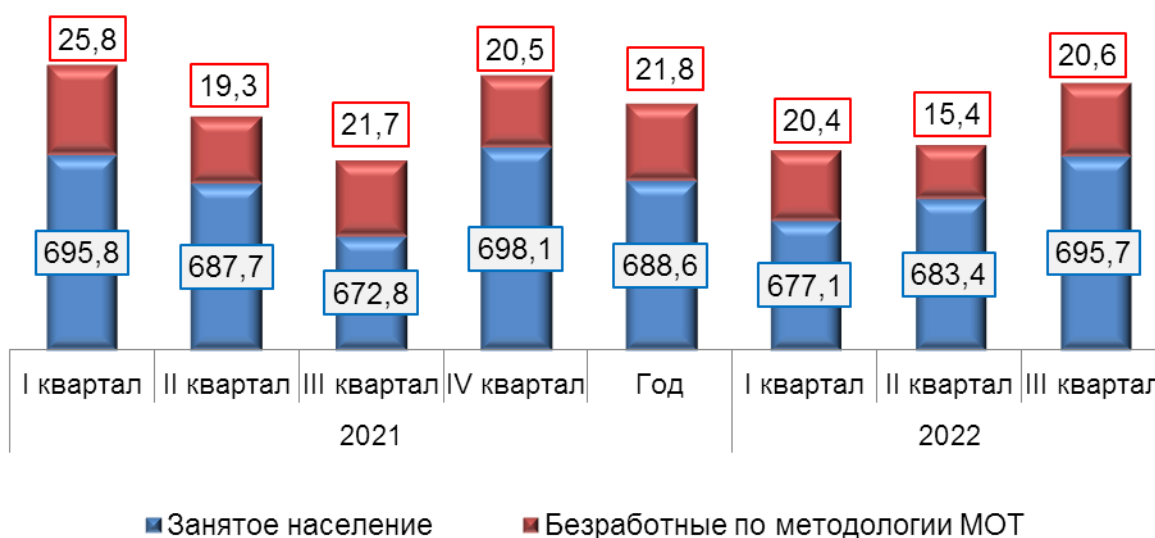
Динамика численности рабочей силы (тыс. человек)

Численность населения в возрасте 15 лет и старше за год уменьшилась на 14,0 тыс. человек (1,3%), в том числе численность занятого населения увеличилась на 23,0 тыс. человек (3,4%), численность безработных уменьшилась на 1,1 тыс. человек (5,1%), численность лиц, не входящих в состав рабочей силы - на 35,9 тыс. человек (9,3%).